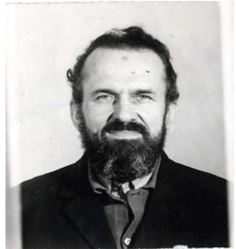
Kazimierz Świtoń

Piotr Surmacz Producent wykonawczy ML Produkcja 2008 na zlecenie IPN Oddział w Katowicach