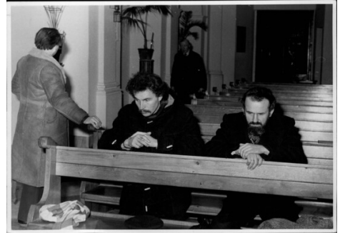
Zdjęcie z głodówki w kościele Świętego Krzyża w Warszawie, 30 XII 1977 r. (K. Świtoń, W. Ziemiński); IPN Ka 048/916, t. 5, k. 4