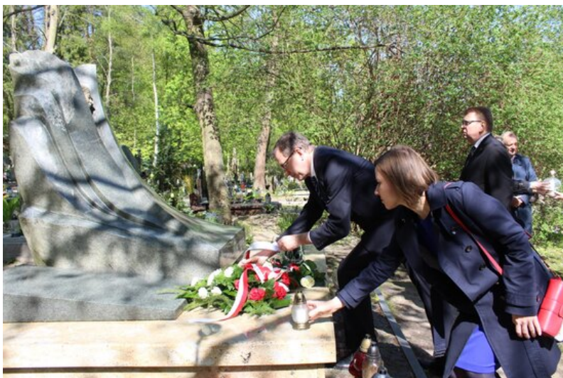
Uroczystości 41. rocznicy powstania Wolnych Związków Zawodowych 1978-1980 – Gdansk, 29 kwietnia 2019 r. 1

https://wzz.ipn.gov.pl/wzz/aktualnosci/20202,Uroczystosci-41-rocznicy-powstania-Wolnych-Zwiazkow-Zawodowy-ch-1978-1980-Gdansk-2.html 09.05.2024, 07:19