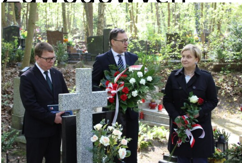
Uroczystości 41. rocznicy powstania Wolnych Związków Zawodowych 1978-1980 – Gdansk, 29 kwietnia 2019 r. 2